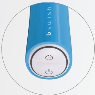
FÁCIL DE CONTROLAR Y CON LUZ ROJA