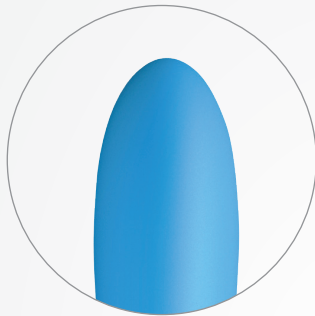
TOUCHER DOUX ET SOYEUX CHAUFFE POUR DES SENSATIONS NATURELLES